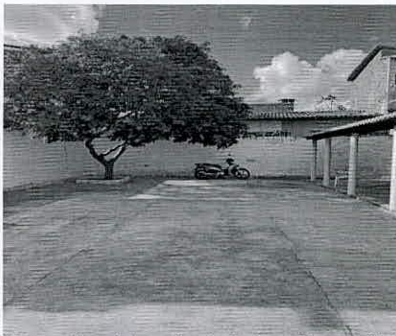
I-Espaço disponível para instalação de um Playground Infantil

Cabe destacar que esta Indicação já foi protocolado anteriormente sob o nº 1245/2022 e 292/2023, sem que tenha sido dado o devido encaminhamento. Diante disso, reitera-se a solicitação para que sejam tomadas as devidas providências necessária.