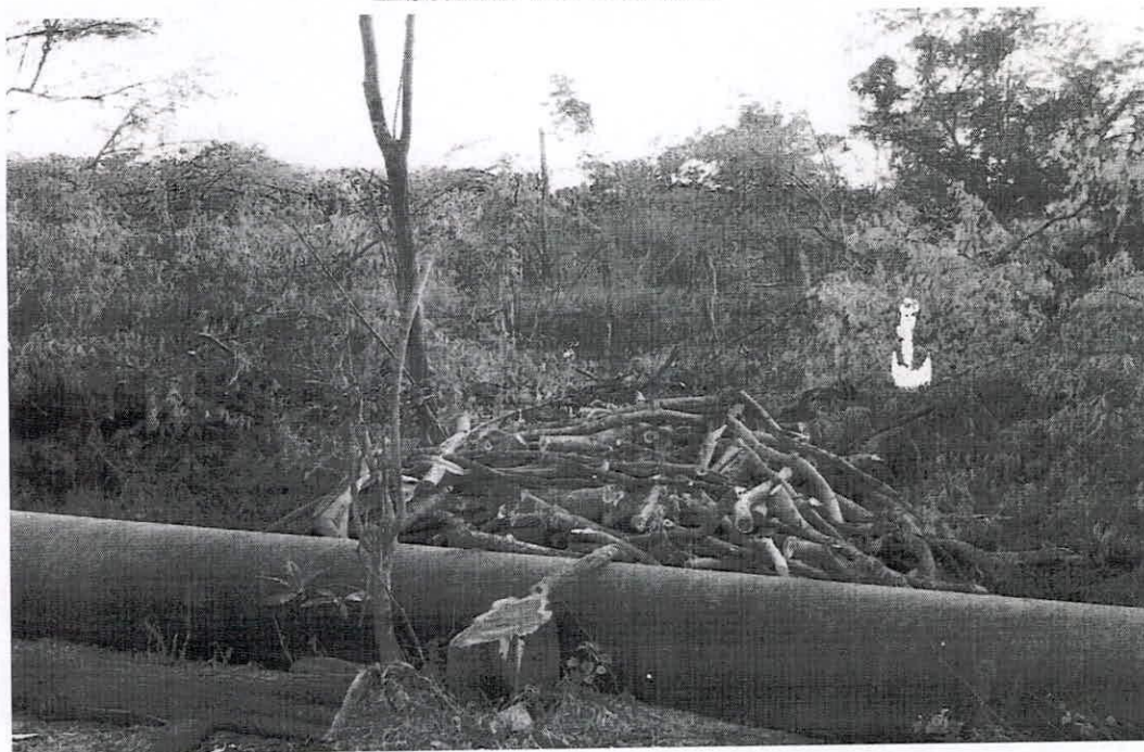
Anexo II – Vegetação desmatada para posterior comercialização da lenha.