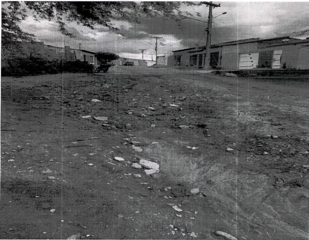
Visita in loco