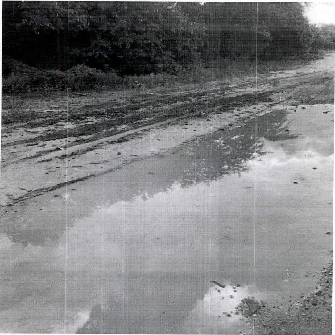
Visita in loco

Pedido realizado por moradores do povoado Riacho e outros. Visto que o local é de grande tráfego uma vez que liga o povoado Riacho (BR 110) à vários povoados como por exemplo o povoado Arrastapé, povoado São Jose, entre outros.