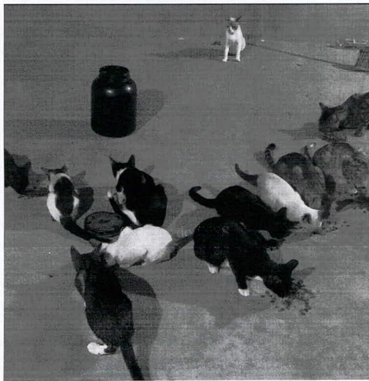
Animais revirando o lixo no dia da coleta procurando alimento.